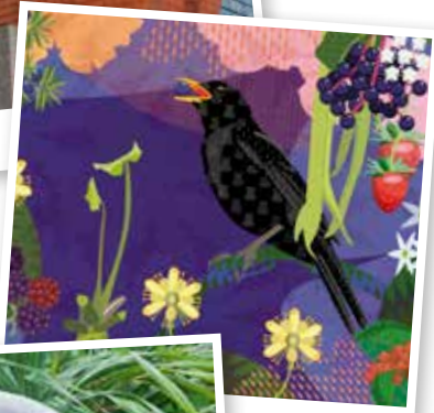
Plant & eter