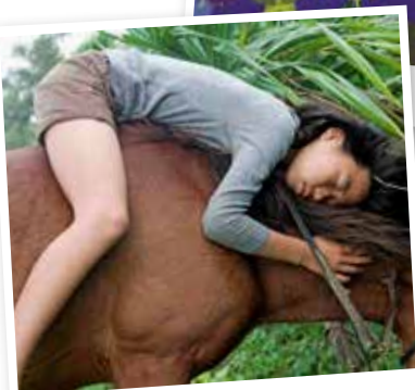
Yuzu en het paard Urara staan centraal in Het paard in de kalebas .

Lammermarkt, op loopafstand van alle musea in de stad.