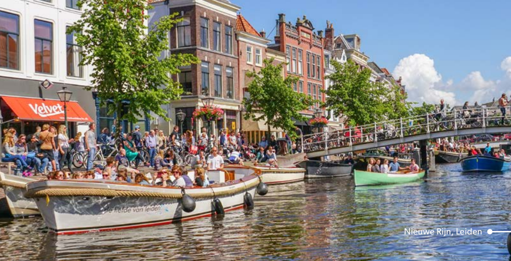
Nieuwe Rijn, Leiden