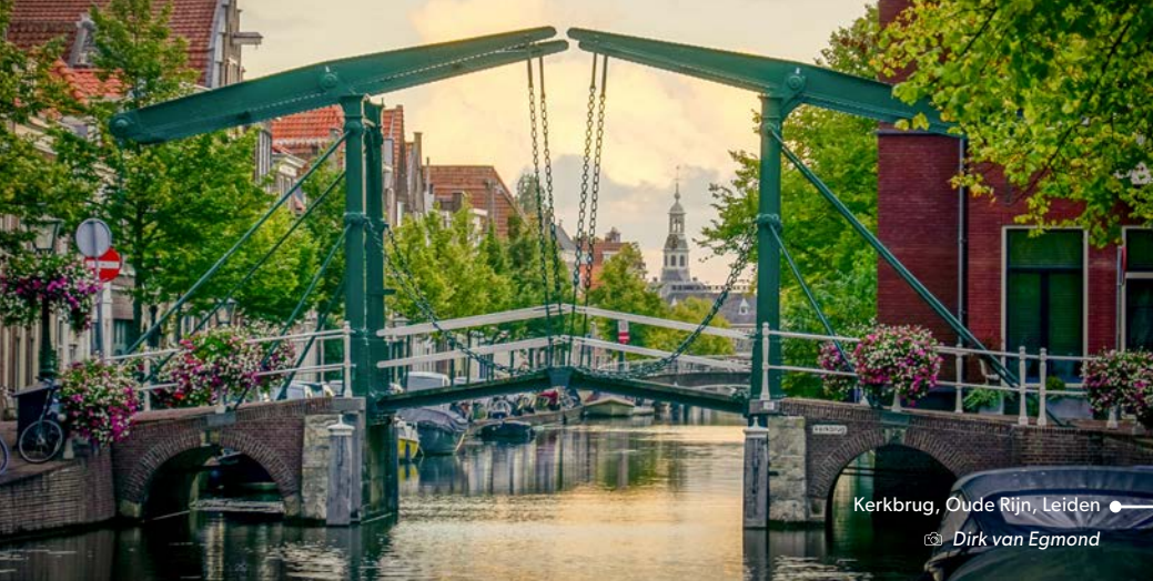
Kerkbrug, Oude Rijn, Leiden Dirk van Egmond